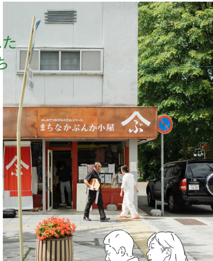
まちなかぶんか小屋 北海道旭川市